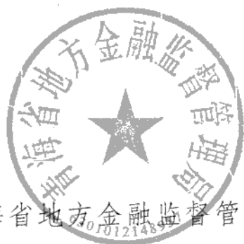
青海省地方金融监督管理局