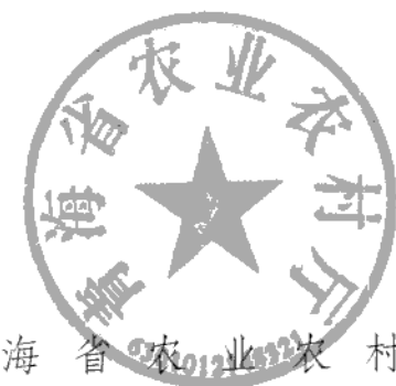
青海省农业农村厅