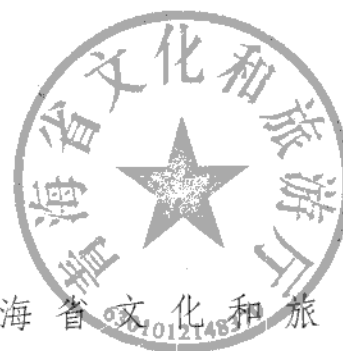
青海省文化和旅游厅