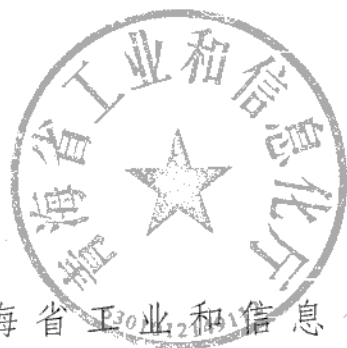
青海省工业和信息化厅